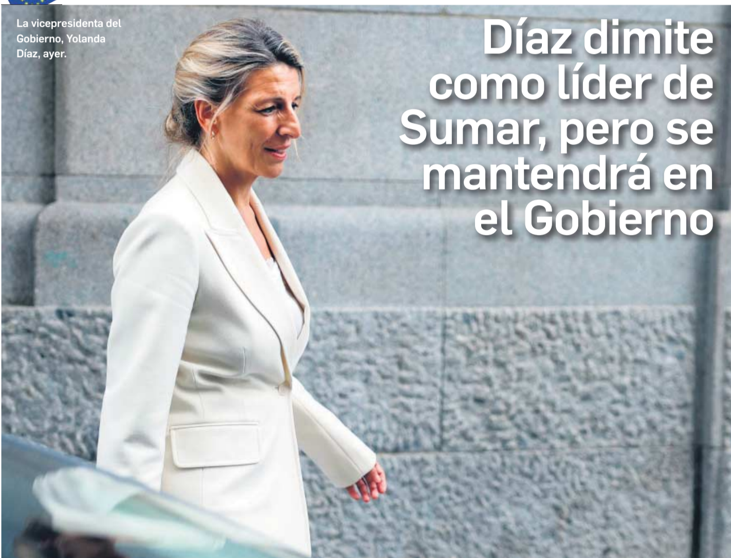
La vicepresidenta del Gobierno, Yolanda Díaz, ayer.

Díaz dimite como líder de Sumar, pero se mantendrá en el Gobierno