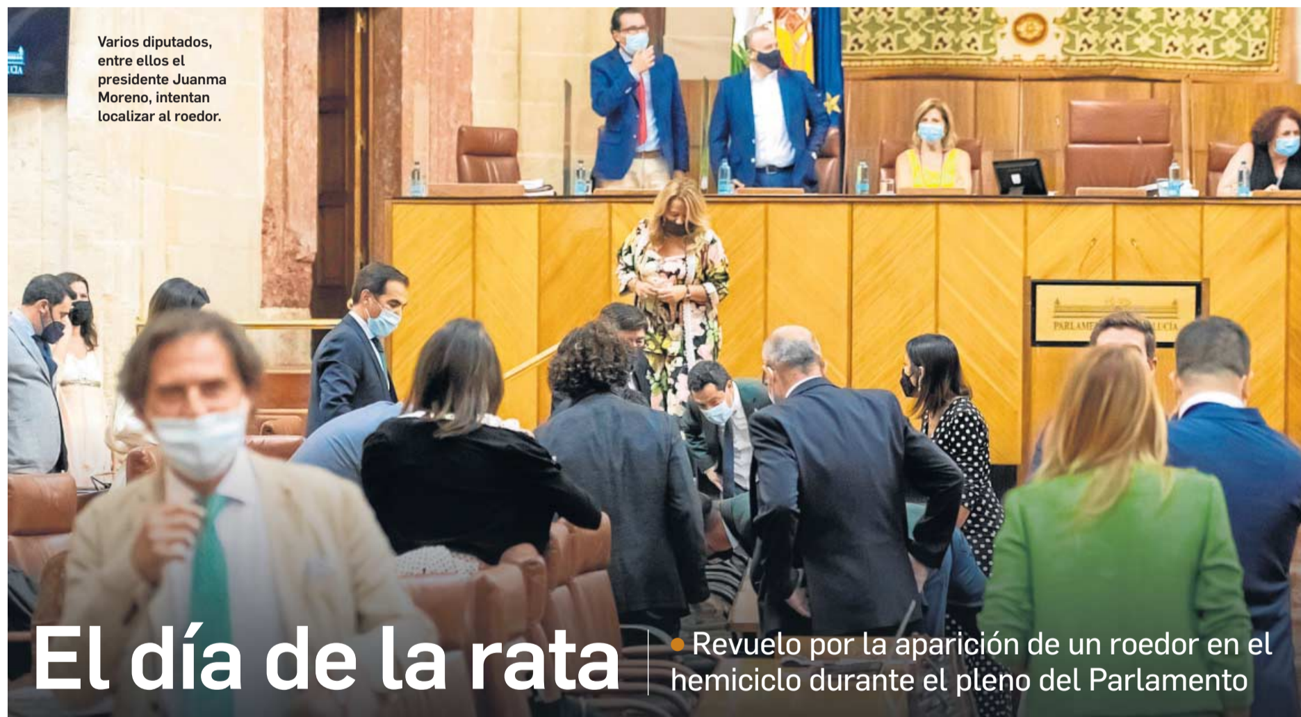
Varios diputados, entre ellos el presidente Juanma Moreno, intentan localizar al roedor.

● La principal norma urbanística de Andalucía avanza tras dos meses en el congelador