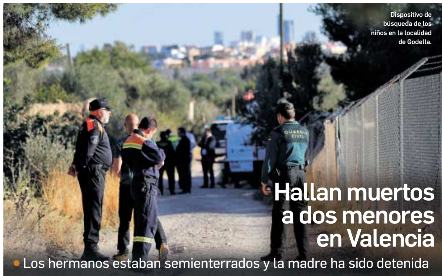
Dispositivo de búsqueda de los niños en la localidad de Godella.

30 LOS FALLECIDOS TENÍAN CINCO MESES Y TRES AÑOS Y EL PADRE ESTÁ SIENDO INVESTIGADO