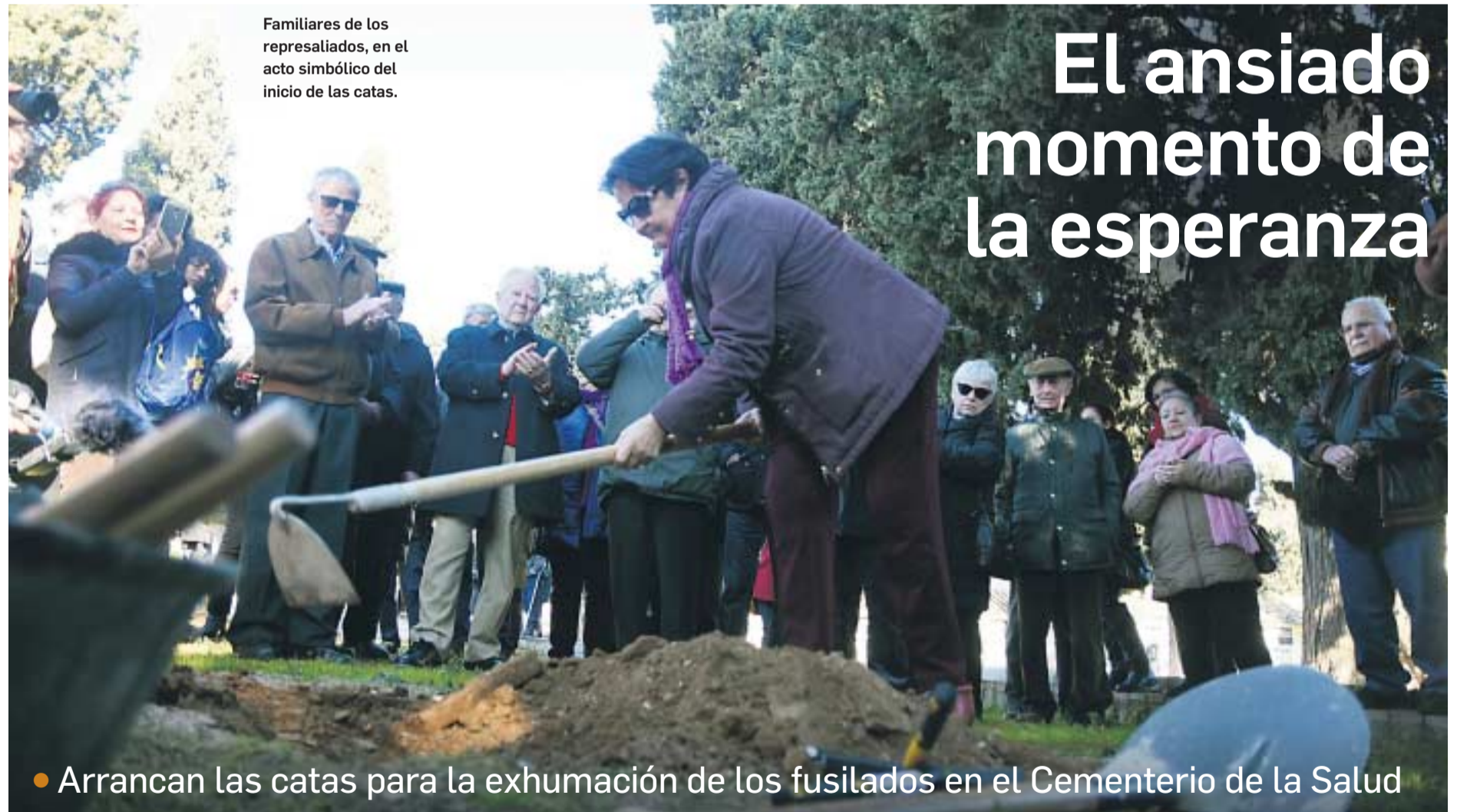
Familiares de los represaliados, en el acto simbólico del inicio de las catas.

7 EL AYUNTAMIENTO ASEGURA QUE MANTENDRÁ LOS TRABAJOS DE MEMORIA HISTÓRICA PESE A LOS CAMBIOS EN LA JUNTA