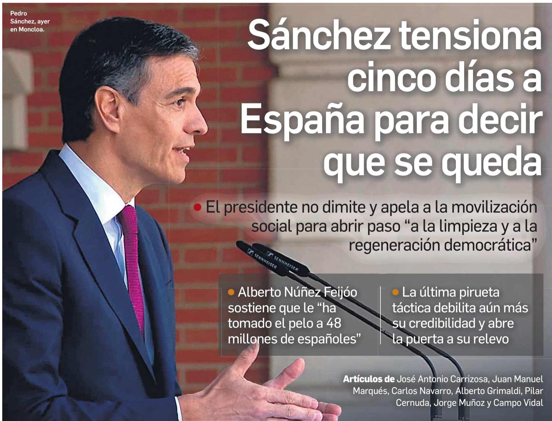
Pedro Sánchez, ayer en Moncloa.

ASEGURA QUE CONTINÚA EN EL CARGO "CON MÁS FUERZA" ▶20-29 / EDITORIAL 2